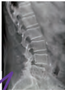
ダイナミック処理