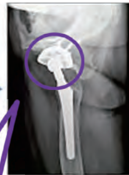
ダイナミック処理