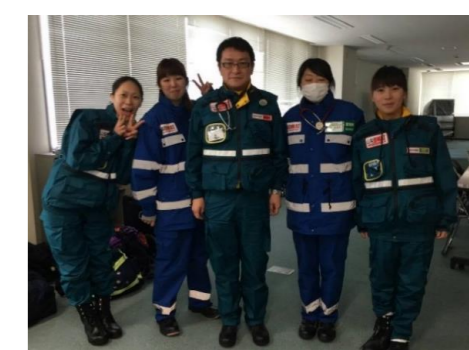
白根徳洲会病院の看護師さん、業務調整員さんとの連合チームで参加となりました。