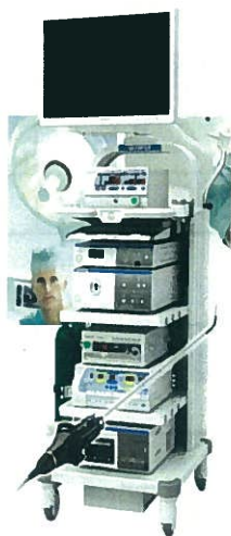
【7月14日学会発表された

本年度は、手術周辺的环境が十分整いましたので、良性疾患に加え大腸を中心とした悪性疾患の手術に力を入れていきたいと思っています。