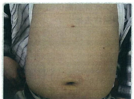
【2孔式 胆のう摘出術図③】